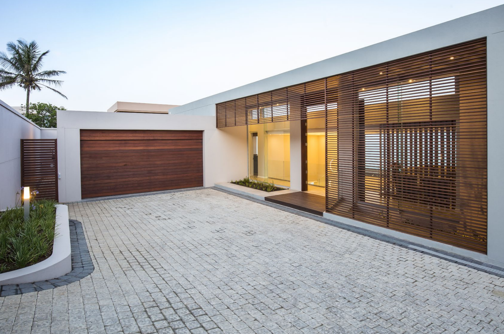
A garázs mögötti védett udvarba tervezett – elegáns üvegporthallal és árnyékolóval hangsúlyozott – bejáratnál már feltárul a nagy kékség.