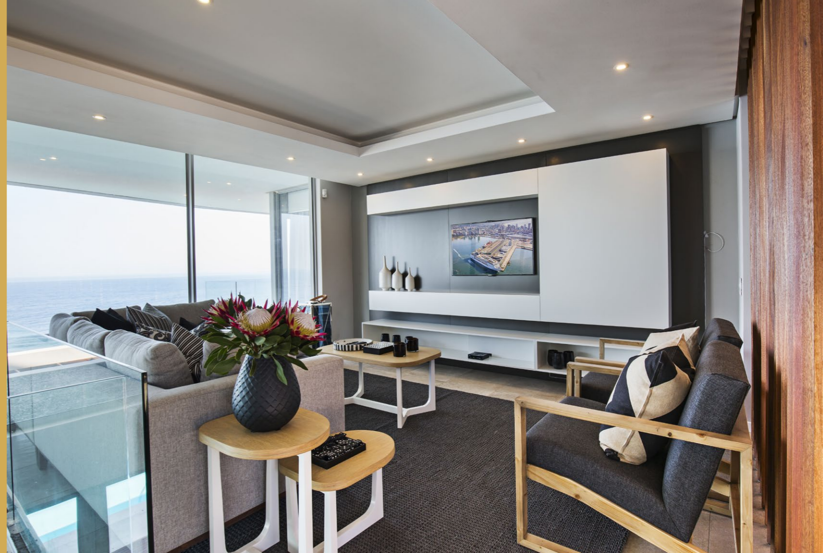
A természetes anyagok képezik alapját a hálószobához tartozó kisebb társalgónak és a fürdőszoba berendezésének is.