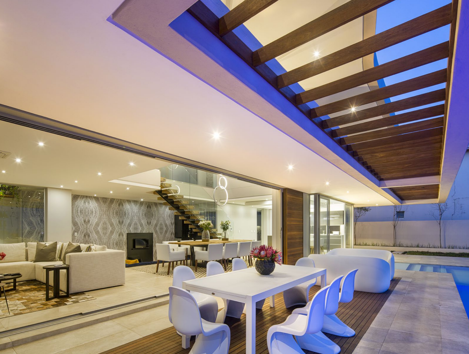
Kifinomult belsőépítészeti koncepcióra épült a társasági élet színtere, ahol a pasztell színvilágot afrikai kortárs elemek dekorálják.