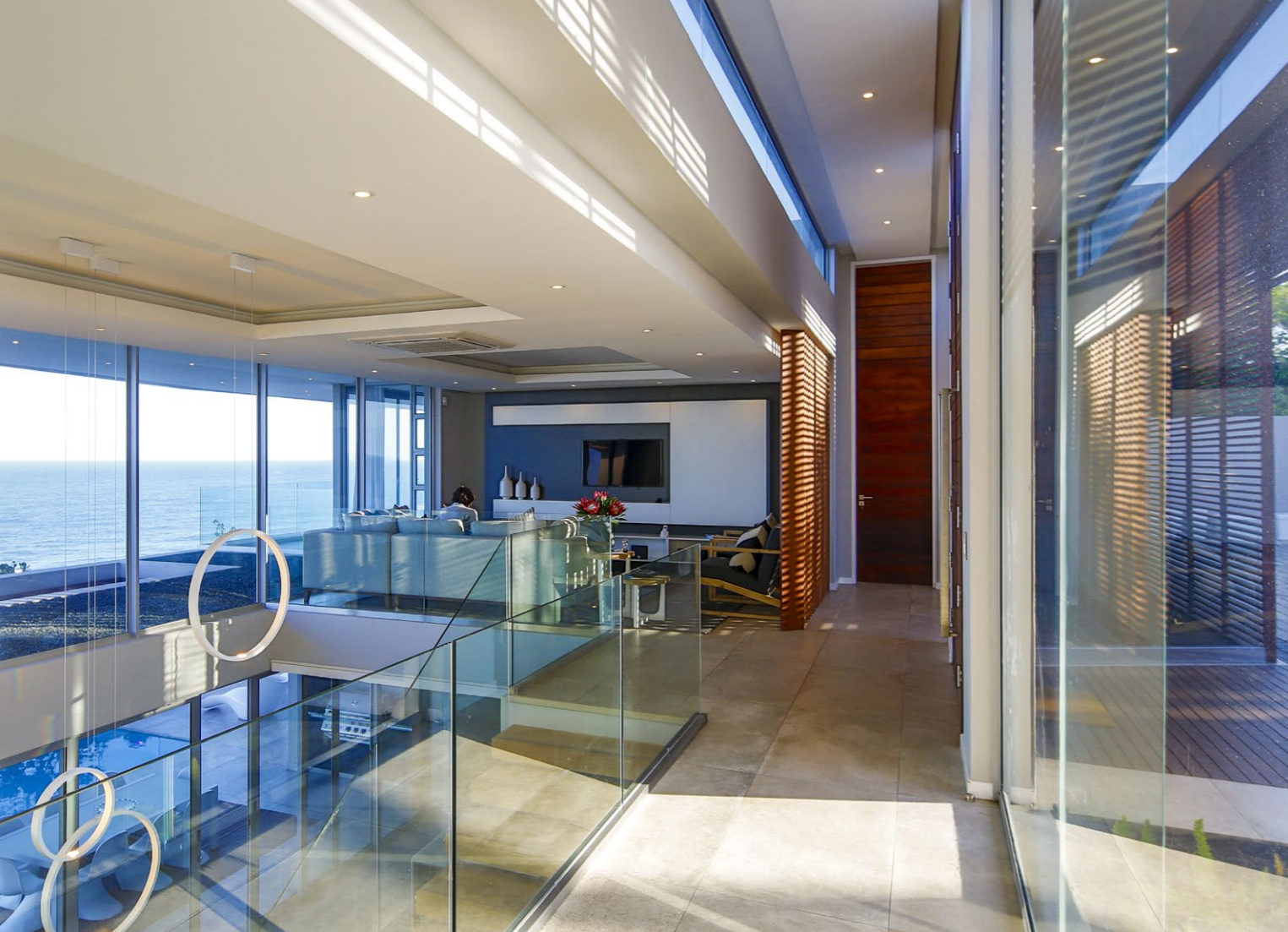
Az alkotók az üvegfelületek túlsúlyával célzottan a lenyűgözésre törekedtek, egyúttal a bejáratról segítve a ház belső tereinek fokozatos feltárását.