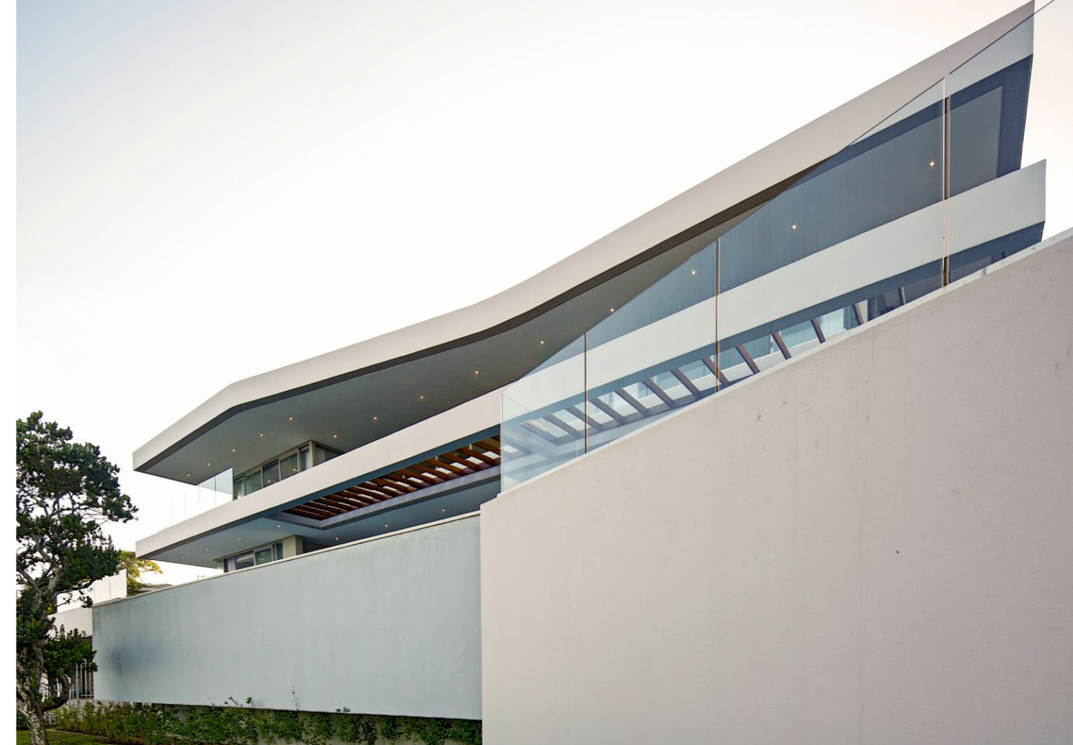
A lejtős terepen kényelmesen elnyújtózó teraszház statikusan merész, de könnyednek tűnő formavilága szemez a tenger végelláthatatlanságával.