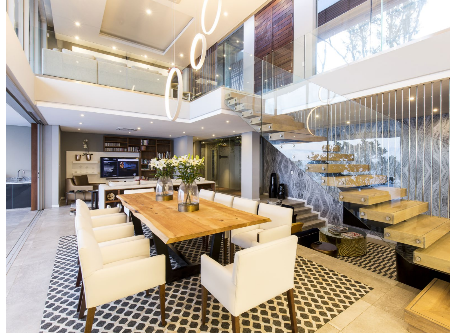
A visszafogott formavilágú, modern bútorok laza elrendezése azt célozza, hogy minden irányból élvezhető legyen a kivételes látvány.

A kinyújtott teraszok vasbeton födémlemezének horizontális sorolása a tengerpart irányából lebegő hatást kelt.