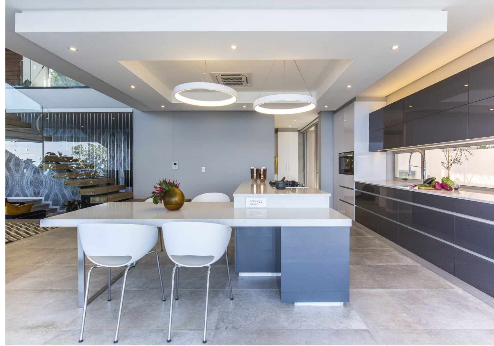
Praktikus és elegáns a konyha bútorozása, emellett irigylésre méltó a helyszíne, amely szinte eggyé válik a medencés terrasszal és a tengerrel.